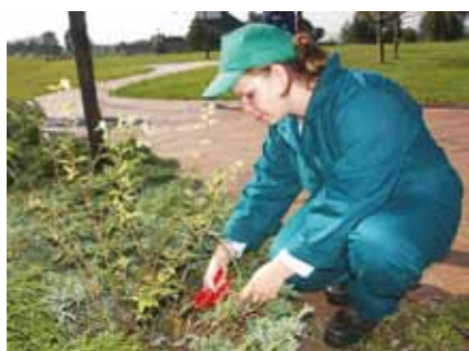
Projektování, údržby, realizace zahrad, parků