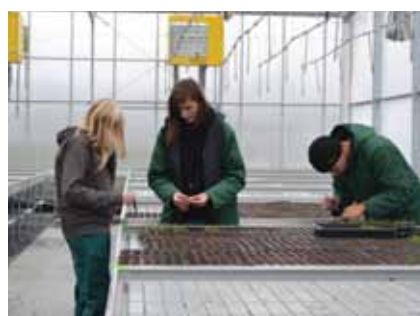
Odborná výuka na pracovních stoly i partnerských podnikcích

MATURITA NA NAŠÍ ŠKOLE - po úspěšném absolvování studia nabízíme možnost pokračovat na naší škole ve studiu v rámci dvouletého nástavbového studia oboru Podnikání, které je zakončeno maturitní zkouškou.