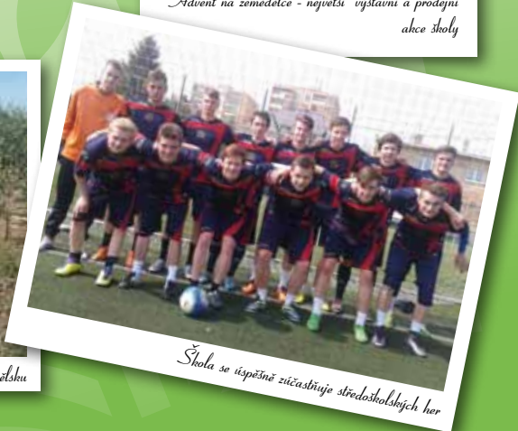
Škola se úspěšně zúčastňuje středostolských her