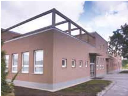
Výuka v nových prostorách

Prizpůsobujeme se požadavkům našich žáků, praxe a moderním trendům (další zvyšování kvalifikace). Příprava žáků pro zemědělství, orientované na základy zemědělské výroby, služeb, opravárenství a dopravu.