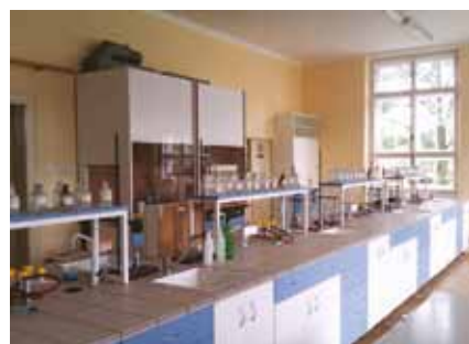
Vlastní chemická laboratoř přímo ve škole