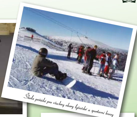
Škola pořádá pro všechny obory lyžařské a sportovní kurzy