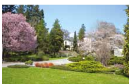
Spolupráce s Arboretum v Novém Dvoře u Opavy