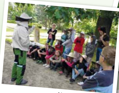
Ve škole funguje včelařský kroužek