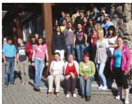
Výuka odborné angličtiny v intenzivních kurzech