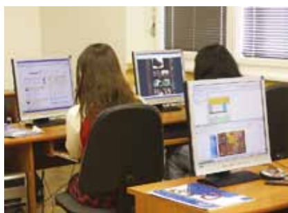
Výuka ekonomických předmětů a cizích jazyků

DALŠÍ STUDIUM NA VOŠ NA NAŠÍ ŠKOLE - po úspěšném absolvování dvouletého studia nabízíme možnost pokračovat na naší škole ve studiu v rámci tříletého studia VOŠ Regionální politika zemědělství a venkova, které je zakončeno absolutoriem a získáním titulu DiS.