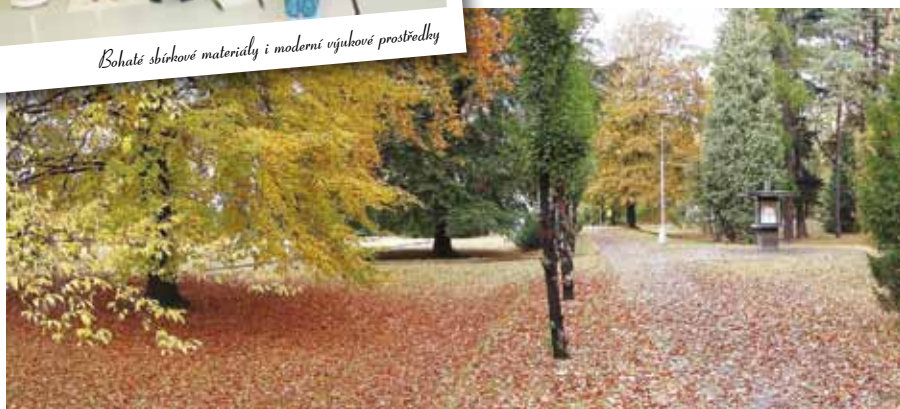
Příjemné prostředí parku a školy

Jedná se o alternativu ke gymnaziálnímu studiu pro žáky, kteří chtějí pokračovat ve studiu na univerzitách a vysokých školách, mají rádi přírodovědné předměty a chtějí studovat na krásné, výborně vybavené škole, jež má s uvedeným oborem největší zkušenosti v rámci ČR.