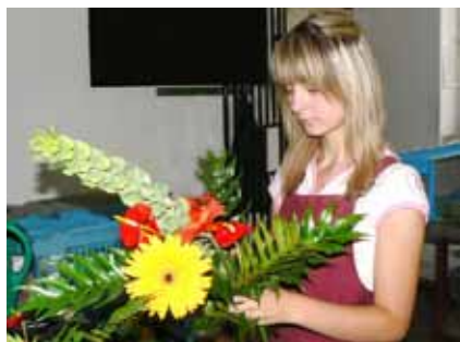
Výuka vazačství a aranžování v květinových síních

Žáci se naučí zvládat práce ve všech zahradnických oborech, dokážou množit, vysazovat, ošetřovat či hnojit zahradnické rostliny ve sklenících i na volné půdě, realizovat sadové úpravy, zhotovit běžné vazačské výrobky a mnoho dalších dovedností využitelných ve všech typech zahradnických komplexů.