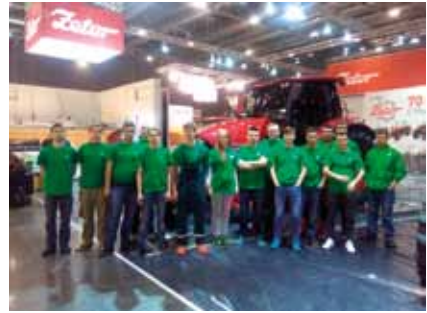
Účast na prohlídkách, soutěžích