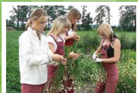
Studenti sbírají materiál pro vazby