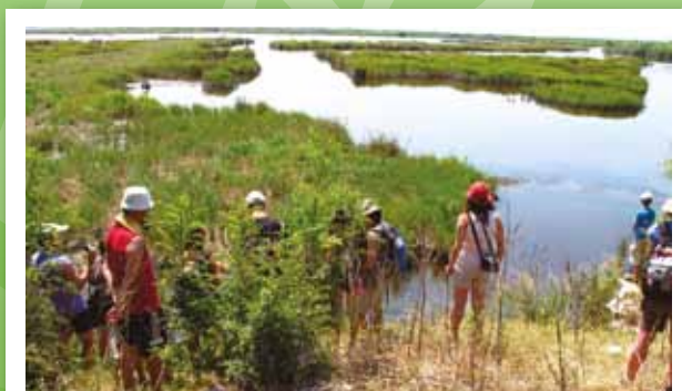
Studenti všech oborů mají možnost zúčastnit se mezinárodních projektů a přírodovědných expedic