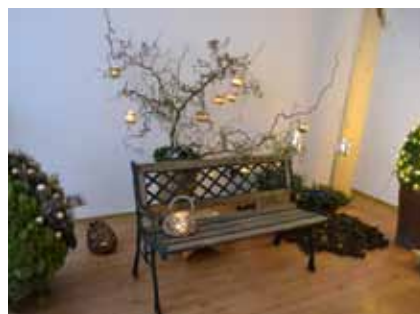
Školní výstavy pro širokou veřejnost v nově vystavěných prostorech pro praxi