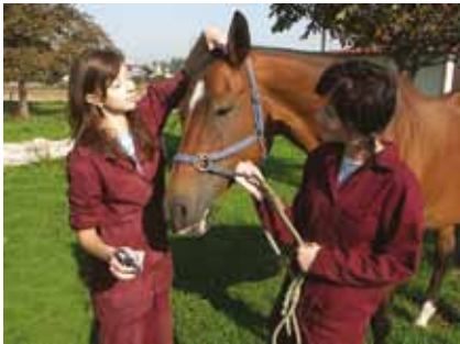
Moderně pojata odborná praxe

Pokračovat se dá i na kterékoliv vysoké škole, a to nejen zemědělského zaměření.