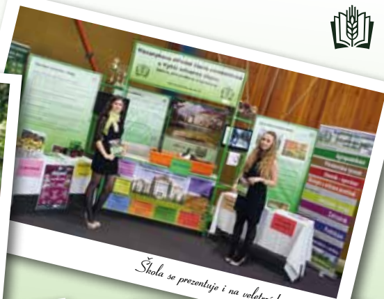
Škola se prezentuje i na veletrzích a výstavách