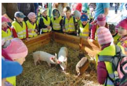
Den mláďat je jarní akce školy pro veřejnost