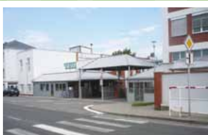
Výuka oboru Chemik operátor ve společnosti TEVA