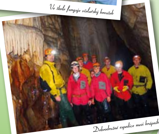
Dobrodružné expedice mezi krápníky