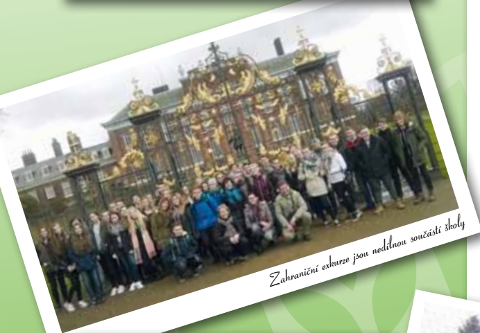
Zahraniční exkurze jsou nedílnou součástí školy