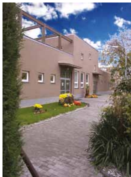
Budova nové haly