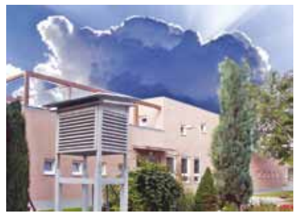
Nabízíme výuku v nadstandardních prostorách

Po ukončení oboru je možné navázat na další studium na VOŠ v naší škole v programu „Regionální politika zemědělství a venkova“.