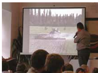
Výuka ve spolupráci s univerzitami a výzkumnými ústavy

Jsmo trenérskou školou Mendelovy univerzity v Brně, spolupracujeme se Slezskou univerzitou v Opavě.