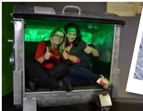
Vzdělávací exkurze do IQLANDIE v Liberci