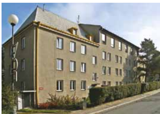
Odloučené pracoviště pro výuku oboru Podnikání