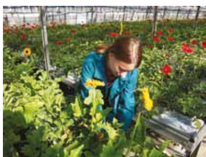
Praxe v zahradnických podnicích v Opavě a okolí

Vůbec největším spolupracujícím podnikem je však Školní statek Opava, který sídlí přímo naproti školy. Provozuje krásný areál drobnochovu se školním jezdeckým oddílem, vlastním parkurem, výběhy, dále ovocnou školku a prodejnu s aranžérskou dílnou. Školní statek hospodář na více než 500 ha pěstuje moderní technikou a chovy hospodářských zvířat.