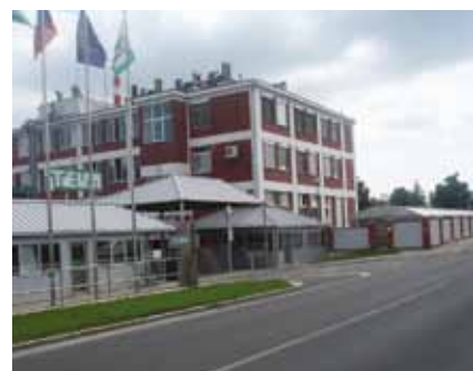
Spolupráce s významnými firmami a zaměstnavateli

Perspektivní zaměstnání v moderních provozech i možnost pokračování ve studiu na univerzitách a VŠ v oboru.