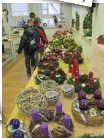
Advent na zemědělské - největší výstavě a prodejní akci školy