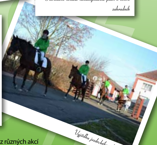
Výjezdka jezdeckého oddělu školy

Veškeré informace o naší škole včetně fotek a videí z různých akcí naleznete nejen na webu www.zemedelka-opava.cz , ale také na oficiálním facebooku školy www.fb.com/zemedelka.opava nebo instagramu @mssze_a_vos_opava