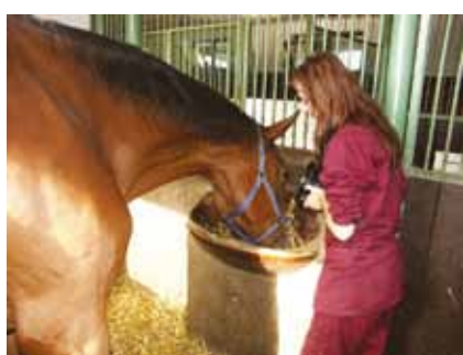
Vlastní jezdecký oddíl v areálu Školního statku