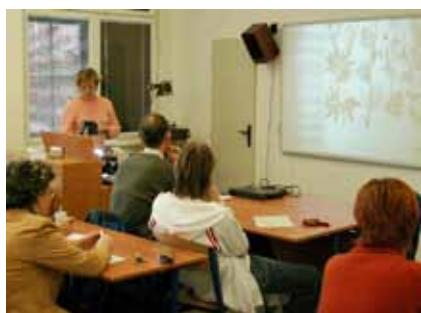
Výuka v jediném oboru v rámci celé ČR