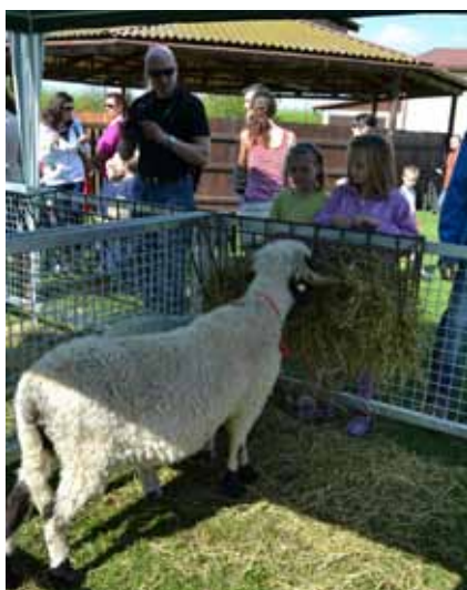
Oslovení zájemců o studium - Akce školy pro veřejnost

Tříleté pomaturitní studium zakončené absolutoriem a získáním titulu DiS. Moderně koncipovaný obor dle požadavků Evropské unie.