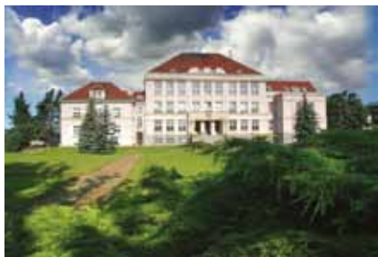
Pohled na hlavní budovu