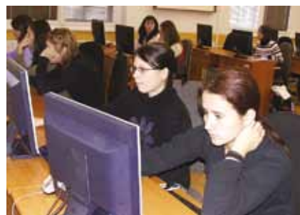
Velké zapojení informačních a komunikačních technologií do výuky, k dispozici 120 počítačů a speciální programy