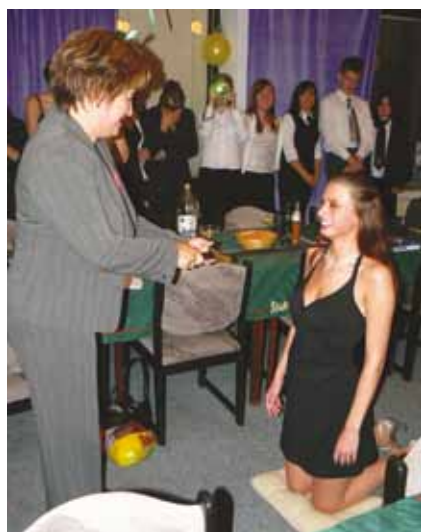
Stužkování maturantů školy - ukončování studia