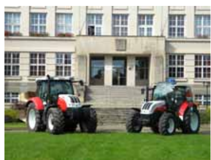
Praxe na moderní technice

MATURITA NA NAŠÍ ŠKOLE - po úspěšném absolvování tříletého studia nabízíme možnost pokračovat na naší škole ve studiu v rámci dvouletého nástavbového studia oboru Podnikání, které je zakončeno maturitní zkouškou.