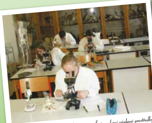
Bohaté sbírkové materiály i moderní výukové prostředky