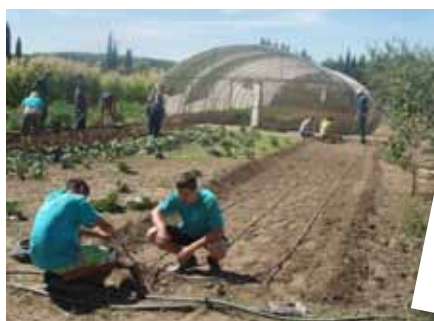
Agro Practice - praxe studentů agropodnikání ve Španělsku