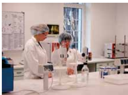
Moderní praxe v laboratorních podmínkách Training centra TEVY