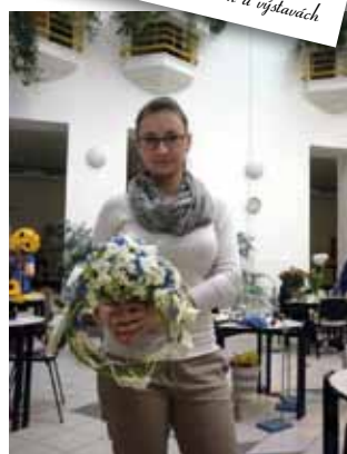
Floristické soutěže neodmyslitelně patří k oborů zahradníků